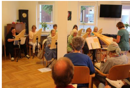
VEEH-HARFEN-KONZERT AM ROSENPLATZ